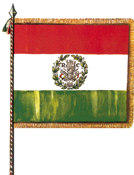
Il primo Tricolore del 1797

1848: durante le Cinque Giornate di Milano il re di Sardegna Carlo Alberto assicura che le sue truppe avrebbero marciato sotto le insegne del Tricolore durante la prima guerra di indipendenza. In quell'anno viene adottato dalle truppe borboniche, papali e veneziane inviate in soccorso