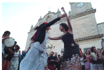
Ragazze che ballano la pizzica