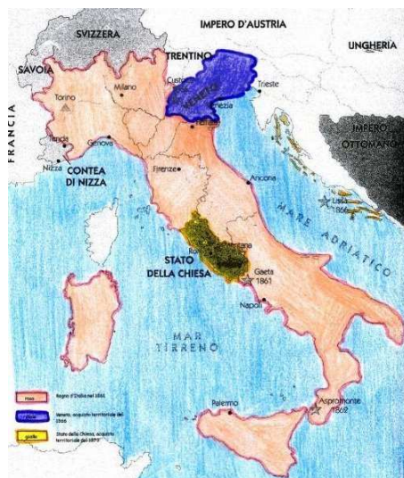
Il Regno d'Italia nel 1861 dopo la spedizione dei Mille.